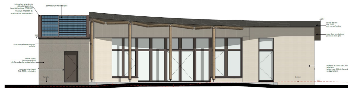
FAÇADE SUD 1/50 ème