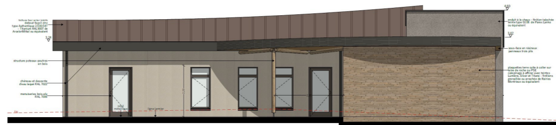
FAÇADE NORD 1/50 ème